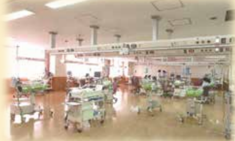
NICU・GCUでの実習 ～小さな赤ちゃんを支える～