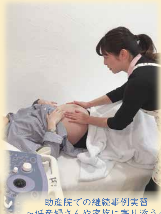
助産院での継続事例実習 ～妊産婦さんや家族に寄り添う～