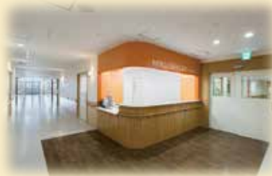
MFICUでの実習 ～ハイリスクのお母さんを支える～